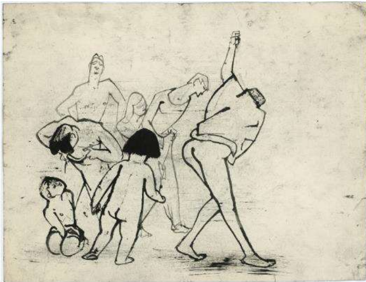
Josef Hegenbarth, Badende, um 1959, Pinsel in Schwarz

Hegenbarth zog 1905 nach Dresden – Schmidt-Rottluff wurde im gleichen Jahr als Gründungsmitglied der Künstlergruppe „Brücke“ berühmt. Während Hegenbarth fast sein ganzes Leben in Dresden blieb, zog es Schmidt-Rottluff 1911 nach Berlin. Beide fanden in ihrer künstlerischen Laufbahn ihren eigenen Stil mit Farbwirkungen und dem Einsatz der Linie. Hegenbarth bevorzugte die Darstellung von Menschen und Tieren – Schmidt-Rottluff wiederum Landschaften und Stilleben . Die Gegenüberstellung der Werke ergibt ein reizvolles Wechselspiel zwischen Fläche und Umriss, ausdrucksvoller Farbe und genauer Linie .