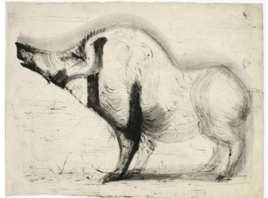
Josef Hegenbarth, Eber, 1962, Pinsel in Schwarz

Probiere die Fell-/Federstruktur mit feuchter oder angetrockneter Pinselspitze nachzumalen!