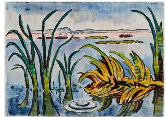
Karl Schmidt-Rottluff, Sommertag (Kastanienallee bei Sierksdorf), 1959, (oben); Schilflandschaft, um 1937, Tuschpinsel und Aquarell