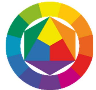
Itens Farbkreis von 1961