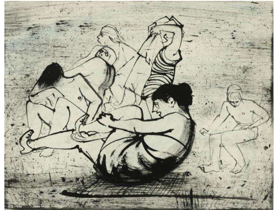
Josef Hegenbarth, Sonnenbad, 1956, Pinsel in Schwarz

Übrigens findest du alle hier abgebildeten Werke bis Herbst/Winter in der Ausstellung. Anschließend hängen wir um und zeigen weitere Bilder von Hegenbarth und Schmidt-Rottluff. Ein erneuter Museumsbesuch lohnt sich also! ☺