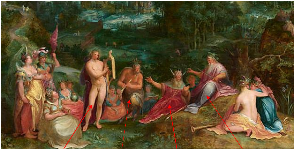
„Landschaft mit dem Urteil des Midas“, Gillis van Coninxloo (1544-1606/07) - https://skd-online-collection.skd.museum/Details/Index/243439

Eines Tages forderte der bocksbeinige Hirtengott Pan den schönen Gott Apollon zum Wettstreit heraus. Der Berggott Tmolos sollte dabei Schiedsrichter sein. Viele Leute fanden sich als Zuhörer ein – so auch König Midas . Zuerst blies Pan mit quäkenden Tönen eine Melodie auf seiner Flöte. Nur Midas lobte sein Spiel. Dann spielte Apollon auf seiner Kythara. Es war wahrhaft himmlische Musik. Tmolos sprach ihm den Sieg zu. Alle klatschten Beifall - nur Midas nicht. Er sagte - so laut, dass Apollon es hören musste - das Urteil sei ungerecht. Apollon bestrafte Midas, indem er ihm Eselsohren wachsen ließ.